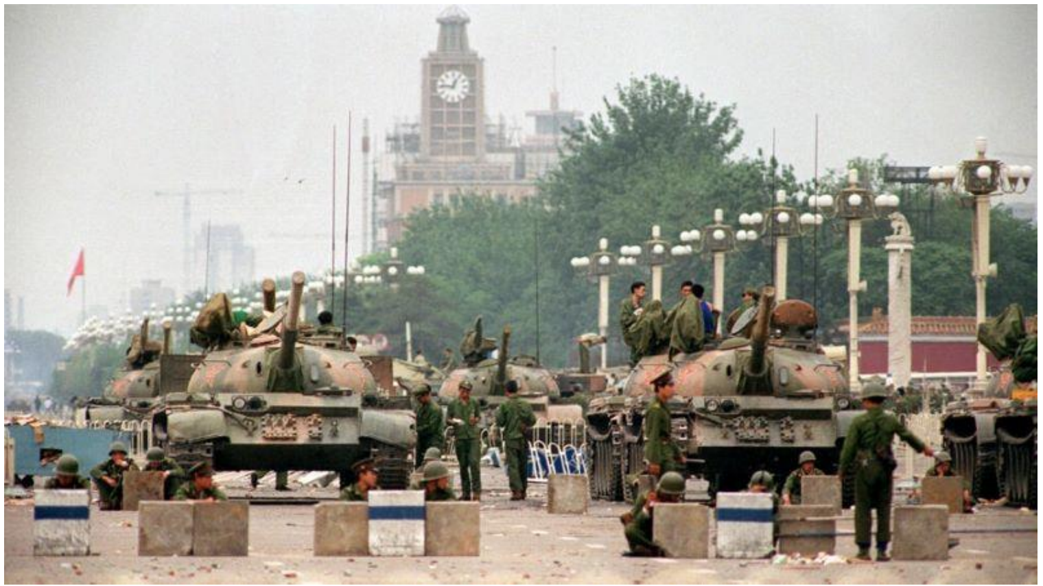
Ảnh tư liệu: Quảng trường Thiên An Môn, Bắc Kinh ngày 06/06/1989 sau vụ đàn áp phong trào biểu tình.

Trên thế giới, lễ tưởng niệm vụ thảm sát Thiên An Môn diễn ra tại nhiều nơi như Nhật Bản, Úc, Mỹ. Ở Tại Luân Đôn, sự kiện Thiên An Môn đã được tái hiện tại Quảng trường Trafalgar. Trong khi đó, ở Đài Loan, vở kịch “ Ngày 35 tháng Năm ” của tác giả Hồng Kông Candace Chong, được công diễn ở tại một nhà hát của Đài Bắc. Một lễ tưởng niệm cũng được tổ chức ở quảng trường Tự Do, trung tâm Đài Bắc, quy tụ được nhiều người dân Đài Loan và các nhà tranh đấu cho Tây Tạng hay Hồng Kông.